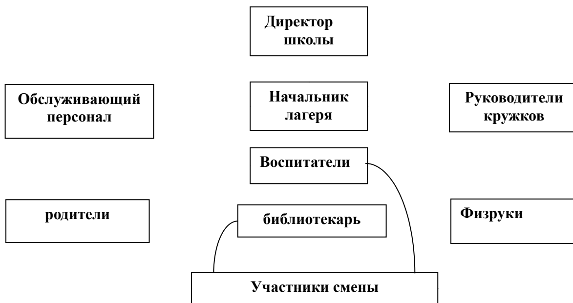
СХЕМА УПРАВЛЕНИЯ ПРОГРАММОЙ

Итогом самоанализа организуемой в детском лагере воспитательной работы является перечень выявленных проблем, над которыми предстоит работать педагогическому коллективу.